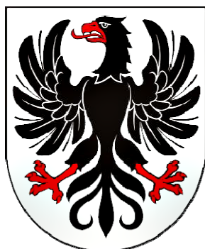
Mesto Rimavská Sobota